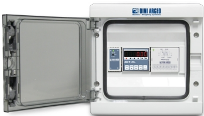
DGT1: esempio di installazione in scatola da parete BOX2121S con modulo profibus PROF1232 e alimentatore interno.